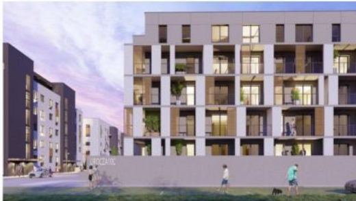
Mieszkanie nr 16